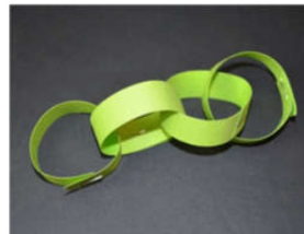
Das Ganze wiederholen, bis die gewünschte Länge erreicht ist.