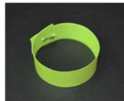
Aus einem Streifen einen Papierring formen. Die Enden zusammen kleben oder heften.