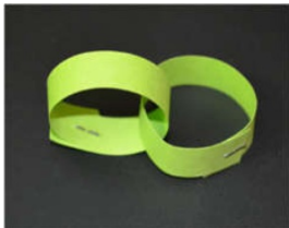
Einen weiteren Papierstreifen durch den Ring ziehen, daraus den nächsten Ring formen und auch den an den Enden zusammenkleben oder heften