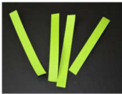
Papier in Streifen schneiden oder fertige Papierstreifen nutzen.

Papier bzw. Tonpapier, Schere, Kleber oder Hefter